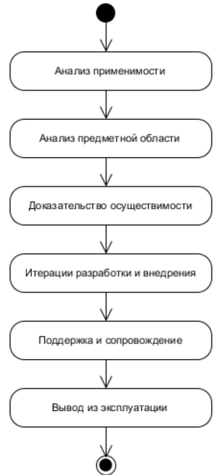
Рис. 1: «Классическая» методика разработки.

Основной этап предлагаемой методики — прототипирование языка — начинается сразу после этапа анализа применимости. Разработчик языка и будущий пользователь работают за одним рабочим местом. При запуске DSM-платформы они видят канву для рисования и пустую палитру. Пользователь объясняет, что он примерно хотел бы нарисовать, разработчик языка добавляет на палитру новые элементы, определяет для них графическое представление, пользователь рисует. Пользователь может сказать, что такой-то элемент должен содержать такую-то дополнительную информацию, тогда разработчик добавляет элементу новое свойство, задаёт его тип, пользователь продолжает рисовать диаграмму, используя новое свойство. Через некоторое время пользователь может сам добавлять и редактировать типы элементов, работа полностью передаётся ему, а разработчик языка лишь следит